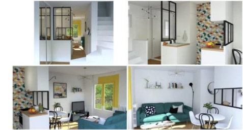
Dans une suite parentale...

Elle m'a également été très utile, lors du projet « Décoration Arty sur une cuisine ouverte » où je devais mettre la cuisine dans le couloir. Cela me permettait dès l'entrée de créer une sensation de volume. Je pouvais ainsi faire entrer la lumière naturelle dans ce nouvel espace. Le salon devenait ainsi traversant et de ce fait plus lumineux et visuellement plus spacieux. Pour ce projet, j'avais fait le choix de mettre la verrière en version fixe mi-hauteur, posée sur un petit muret. Cela me laissait le champs libre pour disposer des rangements sous la partie basse.